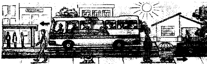
(Ciências, Ecologia e Ed. Ambiental - Airon, Nicolau e Toledo - 8ª série - Ed Scipione - 4ª ed. - pág. 65)

Considere a figura abaixo e responda à questão de número 48.