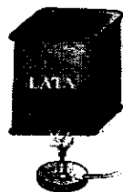
Figura 2a: Lata sendo aquecida

37. Em laboratório, ou mesmo em sala de aula, pode-se realizar o experimento ilustrado abaixo para evidenciar a ação da pressão atmosférica. Nela, uma lata de alumínio com um pouco de água é aquecida até esta água evaporar. Imediatamente a seguir, ela é virada de cabeça para baixo sobre uma superfície plana, e, ao se resfriar, ficará toda amassada pela ação da pressão atmosférica.