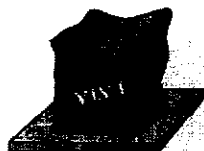
Figura 2c: Lata amassada pela pressão atmosférica

(Telecurso: Ciências: vol.1, ensino fundamental / Nélio Bizzo et al. 1ª ed. Rio de Janeiro: Fundação Roberto Marinho, 2006 - pág. 85)